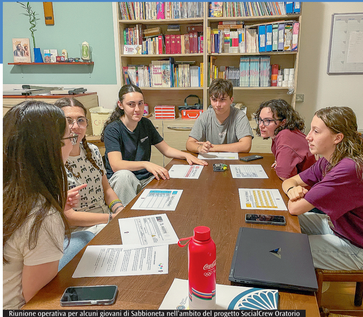
Riunione operativa per alcuni giovani di Sabbioneta nell'ambito del progetto SocialCrew Oratorio