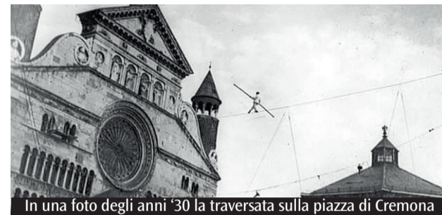
In una foto degli anni '30 la traversata sulla piazza di Cremona

A più di novant'anni dalla storica traversata negli anni '30, una linea tornerà sospesa sopra il cuore della città. Il progetto nasce da CremonaCheCasca, un gruppo di studenti e giovani liutai fuorisede e cremonesi uniti dalla passione per la slackline e per la ricerca artistica nello spazio urbano. L'idea è quella di tendere una highline tra il Torrazzo e la torre dell'acquedotto, attraversandola sopra piazza del Comune: un gesto essenziale che diventa incontro tra equilibrio, e ricerca di se stessi. «Volevamo restituire qualcosa di bello e affascinante alla città che ci ha accolti - racconta il gruppo -. Non solo una prova tecnica, ma un'esperienza capace di far trasalire il cuore dell'uomo e riempirlo di stupore». L'esibizione oggi e martedì.