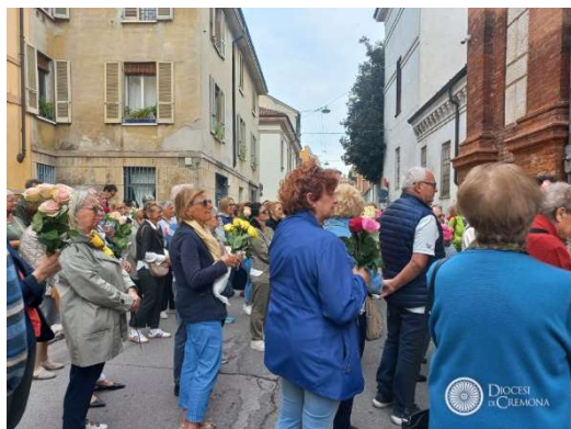
Benedizione delle rose – Festa di S. Rita 2025

Egli vive e regna nei secoli dei secoli. Amen