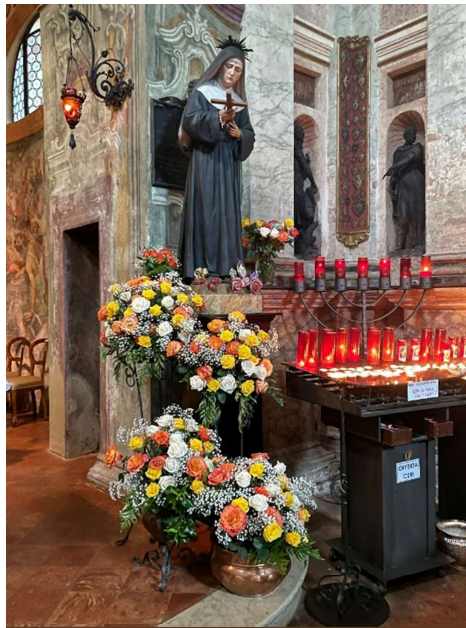
Festa Santa Rita – 22 Maggio 2025

Donna di grande dignità, di motivata fede, di fiera presenza nei suoi diversi stati di vita, ha compreso e vissuto, la Sapienza della croce, piena manifestazione