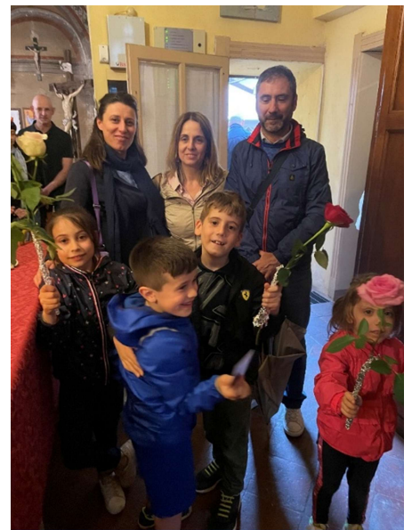
La gioia dei Bambini nel giorno di S. Rita

Album di 16 pagine con 16 disegni al tratto che il bambino può colorare