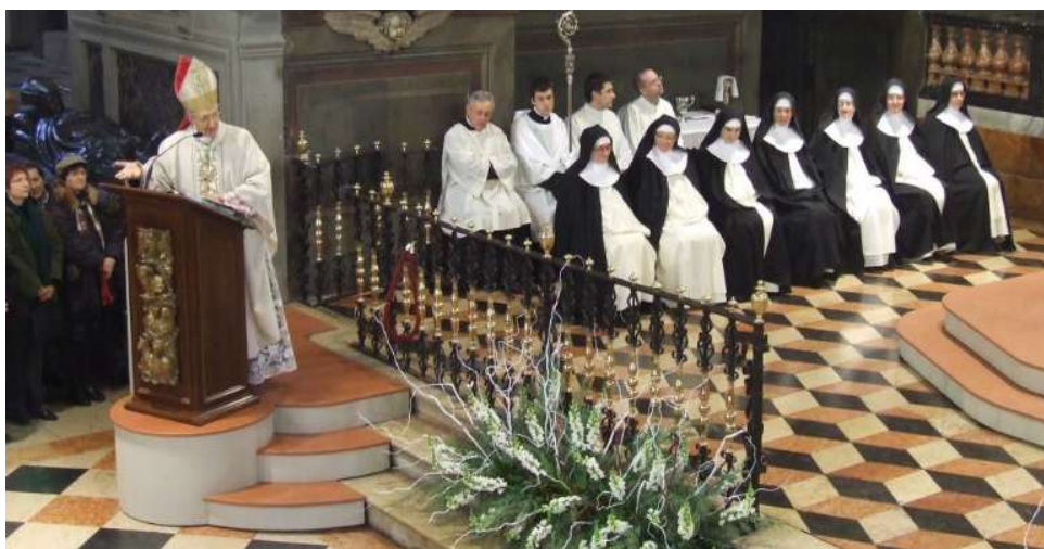
Cattedrale – Accoglienza delle Monache Domenicane, 8 dicembre 2007