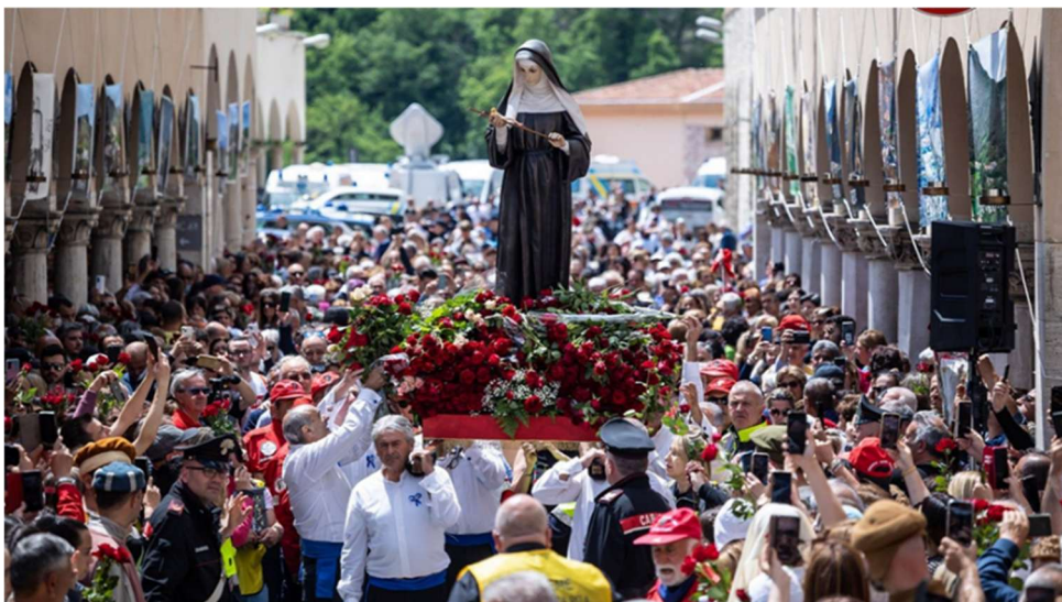
Cascia – Processione in onore di S. Rita