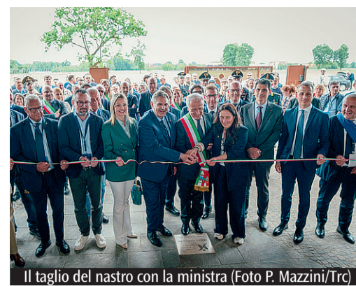
Il taglio del nastro con la ministra

altri potranno usufruire delle nostre competenze, per alleviare altre sofferenze, ben venga». Il ministro Locatelli ha voluto sottolineare come «l'inaugurazione rappresenta un passo importante per tutto il Paese», perché «nasce un luogo che mette al centro la persona, la dignità, il diritto alla cura e il sostegno concreto alle famiglie». Tra gli interventi degli ospiti presenti anche quello di suor Veronica Donatello, responsabile del Servizio nazionale della Cei per la Pastorale delle persone con disabilità, che ha voluto esprimere gratitudine per la nascita di questo centro che «rappresenta non solo un traguardo scientifico e sanitario, ma un segno di civiltà, di umanità e di speranza. In un tempo in cui spesso il valore delle persone viene misurato dall'efficienza, dalla produttività o dall'autonomia, que-