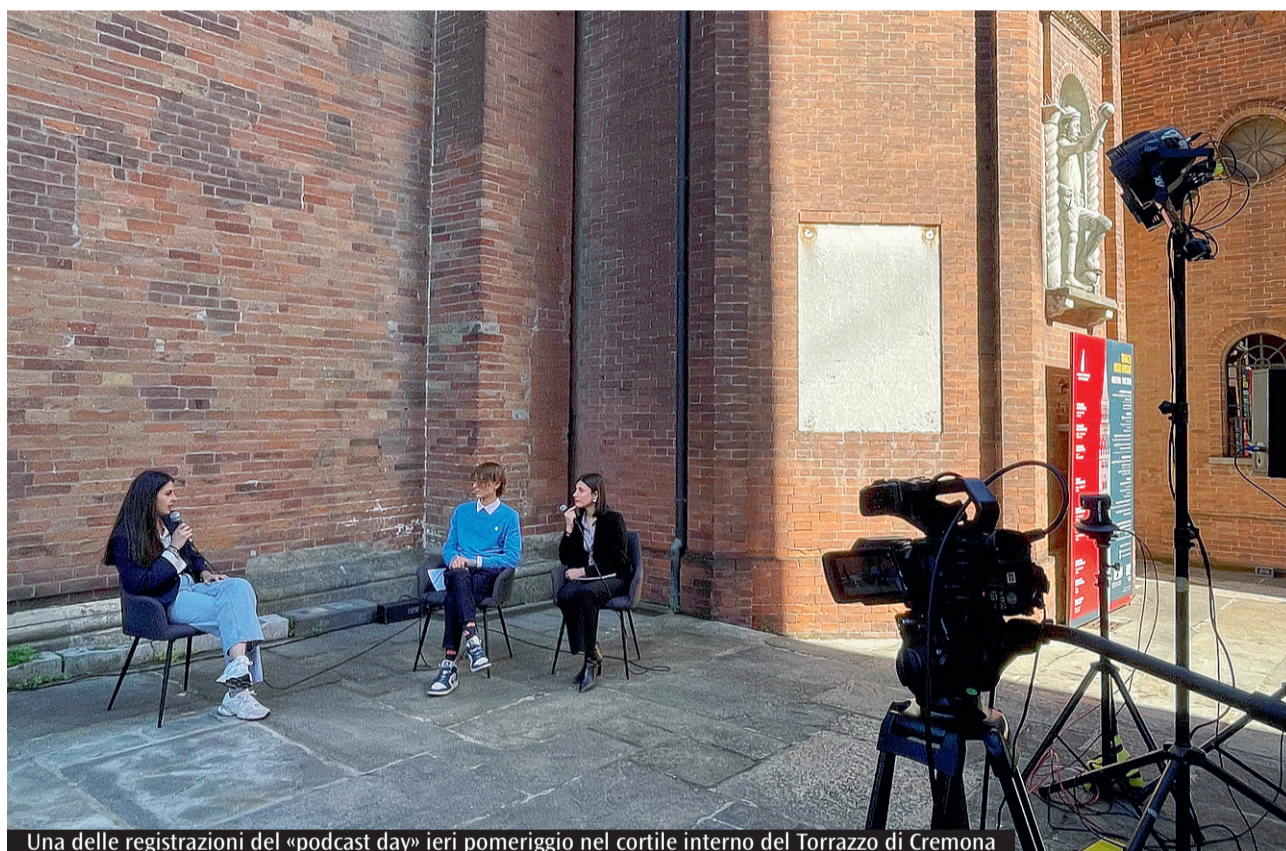
Una delle registrazioni del «podcast day» ieri pomeriggio nel cortile interno del Torrazzo di Cremona