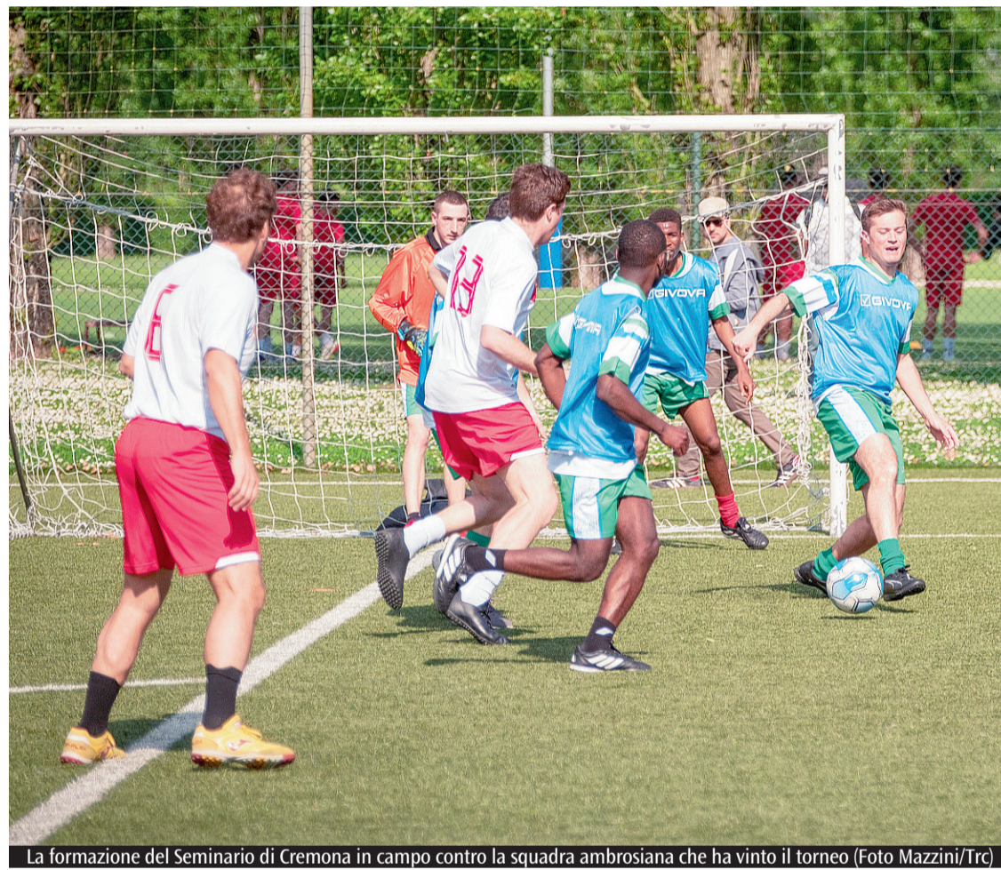
La formazione del Seminario di Cremona in campo contro la squadra ambrosiana che ha vinto il torneo