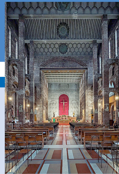
La chiesa di Sant'Ambrogio a Cremona