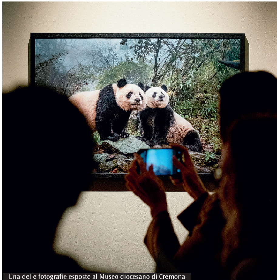
Una delle fotografie esposte al Museo diocesano di Cremona

La partecipazione di numerose fotografe donne non è casuale: è una dichiarazione d'intenti che mira a riconoscere il contributo fondamentale del genere femminile nella fotografia naturalistica e nella conservazione ambientale. Il risultato è una trama corale che racconta la fragilità e, allo stesso tempo, l'incredibile forza di Madre Terra.