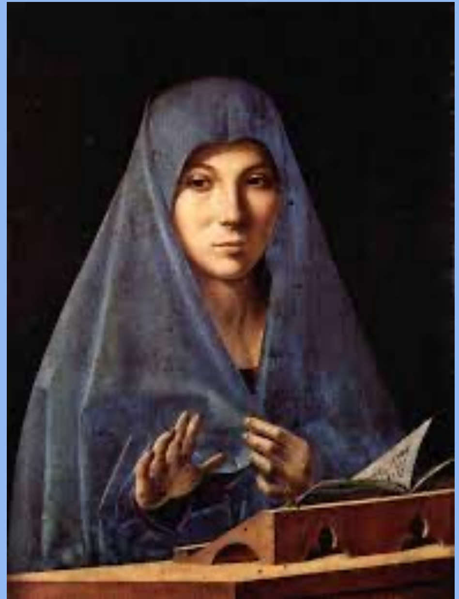
Antonello da Messina, Annunciata