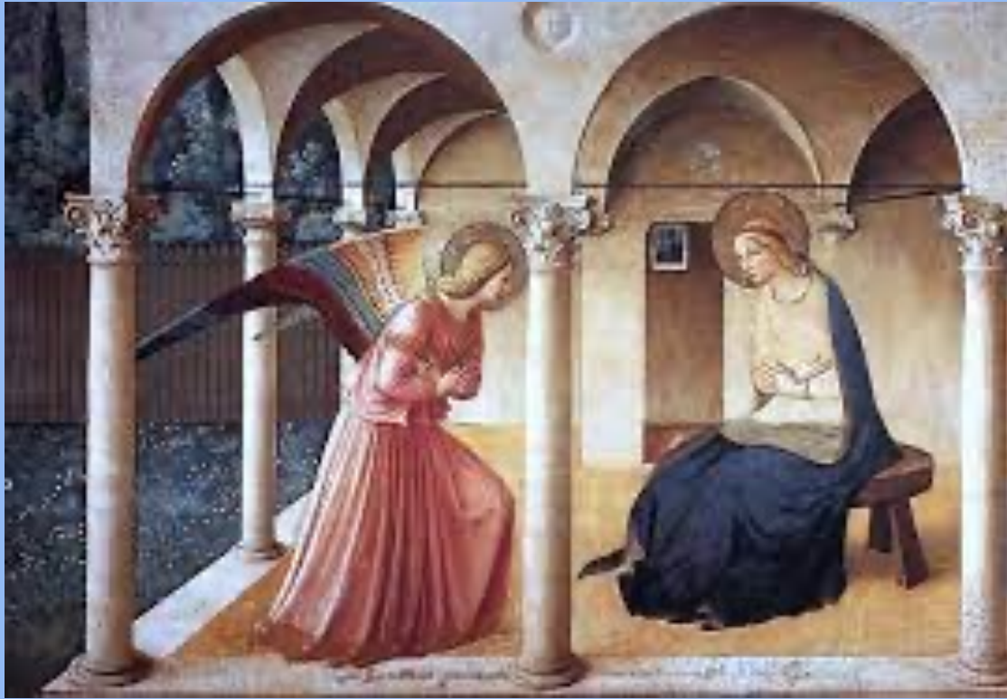
Beato Angelico, Annunciazione