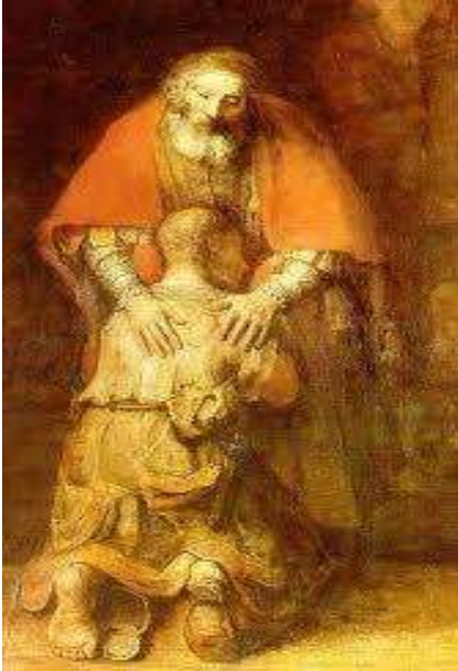
Dio padre amoroso di Rembrandt

Lettura dell'immagine attraverso domande stimolo( cosa rappresenta l'immagine, posizione dei personaggi, colori, prospettiva....)